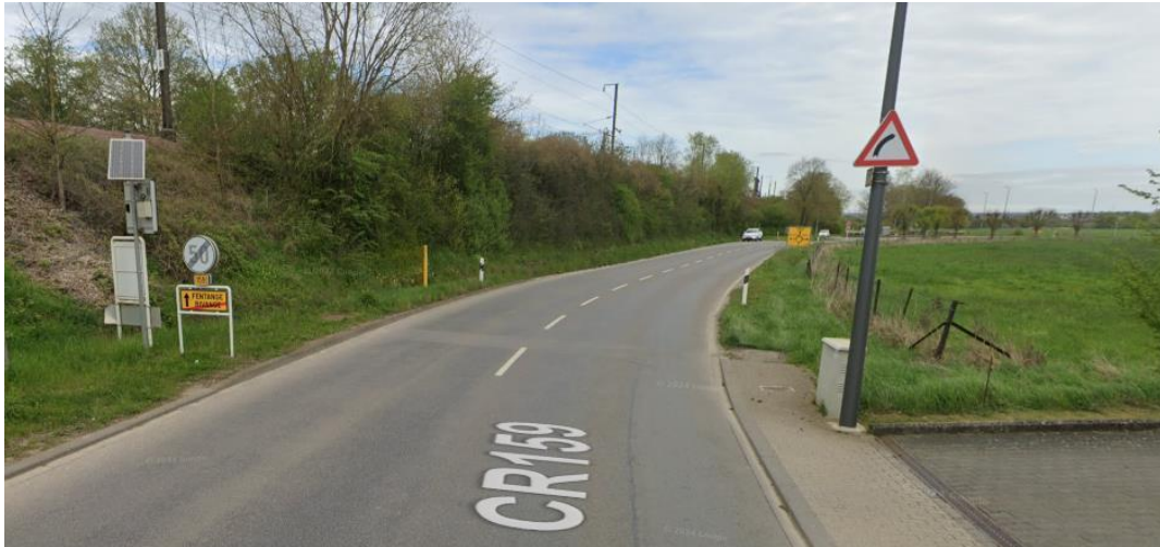
Photo 2 : La rue Edward Steichen à la sortie de Bivange