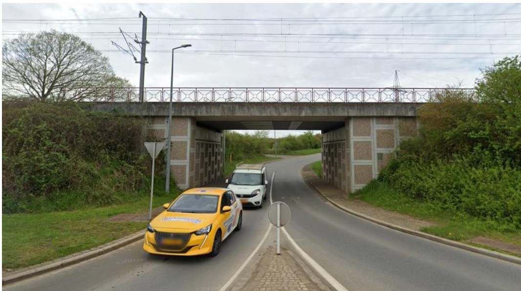
Photo 3 : Trottoirs sous le pont ferroviaire de la CR158.