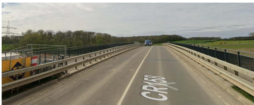
Photo 1 : Chemin mixte non-connecté sur le pont passant l'A3 au niveau du CR158.

Après le rond-point, on passe sous le pont ferroviaire de la CR158 où un trottoir existe mais n'est pas connecté des deux côtés (photo 3), et il reste 200 m à franchir en trafic mixte sur le CR 158 où une limitation de vitesse de 90 km/h est en vigueur (photo 4).