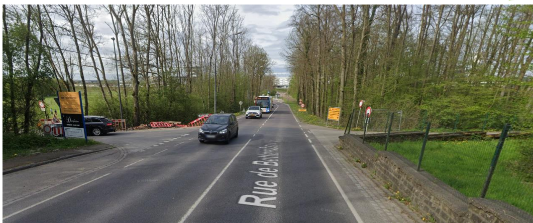
Photo 5 : Piste cyclable croise la rue Bettembourg à Luxembourg de droite à gauche.

Pour rejoindre par la suite le pôle d'échange stade du Luxembourg, la meilleure option est actuellement de continuer sur le chemin agricole mixte qui croise la rue de Bettembourg (CR186) au niveau du terrain de golf (Photo 5, position (5) sur la carte en annexe). Ce croisement est dangereux pendant les heures de pointe : vitesse maximale de 70 km/h, beaucoup de trafic dans les deux sens.